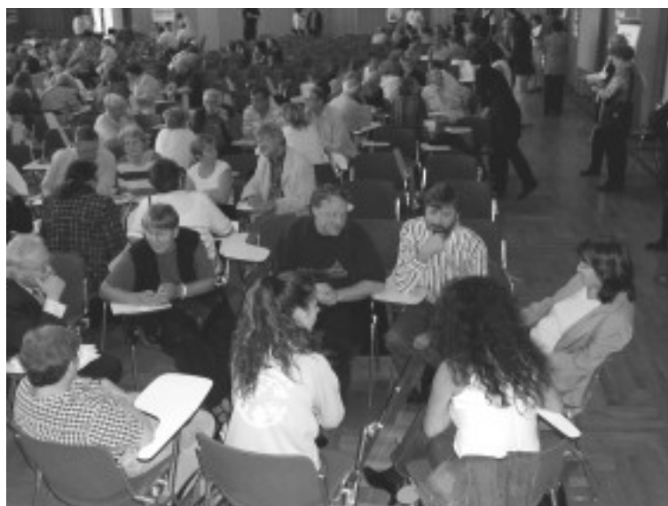
Im Rahmen der Auftaktveranstaltung Arbeit in Gruppen zur Ermittlung der Befürchtungen und Erwartungen.