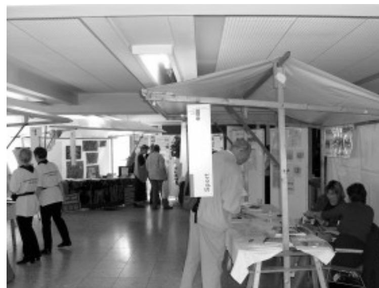
Die Verwaltungsstrukturen stellen ihre Arbeit vor.